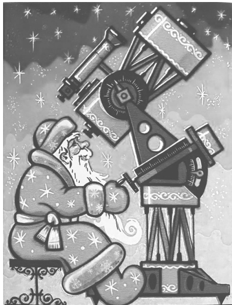
Рис. 1: Рисунок к задаче 9.

Изображенный на новогодней открытке Дед Мороз проводит наблюдения в 00^h00^m истинного солнечного времени 1 января 2026 года. Определите примерные широту места наблюдения и координаты (прямое восхождение и склонение) наблюдаемого объекта, если известно, что наблюдения производятся в России. В каком созвездии находится наблюдаемый объект?